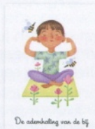
De ademhaling van de bij

Jullie zitten met rechte rug in kleermakerszit, bedekken jullie oren en sluiten jullie ogen. Jullie ademen in door de neus en ademen uit door de mond terwijl jullie het geluid van een bij nadoen: "bzzzzz...". Doordat jullie oren zijn bedekt, kunnen jullie het geluid van jullie ademhaling beter horen. Daar concentreren jullie je op.