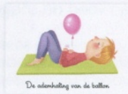
De ademhaling van de ballon

Het kind ligt op de rug en legt de handen op de buik. Het stelt zich voor dat er een ballon in zit in zijn of haar favoriete kleur. Vervolgens haalt het 5 keer diep adem door de neus terwijl het zich voorstelt dat de ballon in de buik wordt opgeblazen en weer leegloopt. Het kind is zich bewust van het op en neer gaan van de handen tijdens het opblazen en leeglopen.