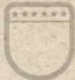
DE ULTIEME ZOMBIEJAGER