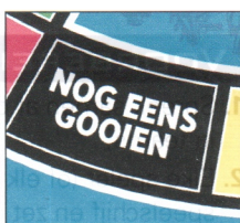
Nog eens gooien