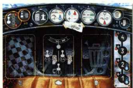
6 spelersborden in despelerskleuren

Het volgende speelmateriaal heb je nodig voor het basisspel. De rest van het speelmateriaal kun je voorlopig in de doos laten. Dat wordt beschreven in het andere boekje.