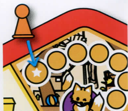
startvakje van de oranje Sloddervospijn

Puzzel het spelbord in elkaar en geef elke speler een tussenschotje. Zet de Sloddervospijn op het startvakje op de zolder. Vervolgens reken je voor elke speler 3 kaartjes en die leg je open op de tafel zodat iedereen ze goed kan zien. De overige kaartjes leg je in een gedekte stapel naast het spelbord. Iedereen bekijkt de open kaartjes gedurende 1 minuut. Daarna schud je de kaartjes door elkaar en krijgt elke speler 3 kaartjes. Deze kaartjes mag hij verbergen voor de andere spelers achter zijn tussenschotje. De grootste speler mag beginnen.