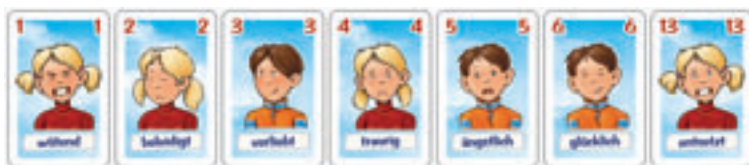
39 Spielkarten, auf jeder Spielkarte ist eines von insgesamt 13 Gefühlen abgebildet. Jedes Gefühl gibt es dreimal.