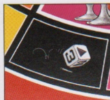
Nog eens gooien