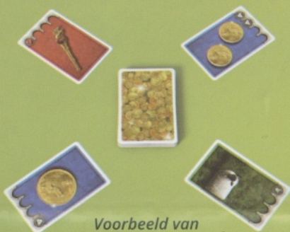
Voorbeeld van de opstelling voor 4 spelers