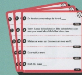
50 rode schrijfkarten (500 vragen)