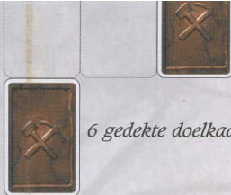
6 gedekte doelkaarten

De markeringen aan de rechterraand van deze handleiding dienen om de afstand tussen de kaarten precies te kunnen uitmeten.