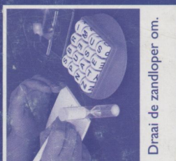
Draai de zandloper om.