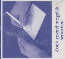
Zoek zoveel mogelijk woorden.