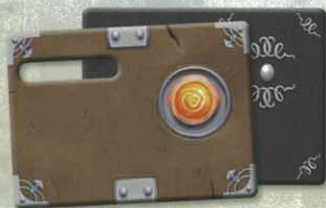
4 Livres cartonnés