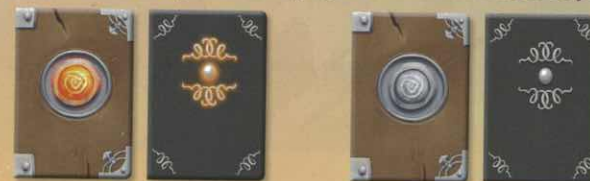
Ces Livres sont passés en premier.

Au début de la manche, si les deux équipes sont dans la même Salle, chaque équipe doit regarder son Livre. Les Livres sont identiques, à l'exception de celui avec un symbole rougeoyant. Dans ce cas, l'Éclaireur qui reçoit le Livre avec le symbole rougeoyant donne les indices en premier.