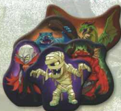
5 figurines Monstre cartonnées