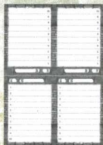
1 carnet de feuilles