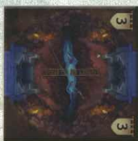
7 tuiles Salle