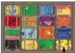
casilla de salida

Colocad el tablero junto a la maleta. Los jugadores cogen un peón y lo sitúan en la casilla de salida del tablero. Cada uno coge las 13 cartas con el reverso del color de su peón.